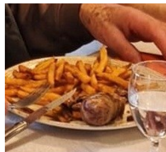
La fameuse andouillette frites..